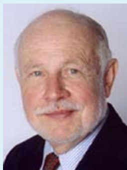
جون نوبل ويلفورد

كاتب متخصص في الشؤون العلمية في صحيفة نيويورك تايمز. حاز على جائزة بوليتزر الصحافية مرتين (للكتاب في الشؤون العلمية). إجازة في الصحافة من جامعة تينيسي. ماجستير في العلوم السياسية من جامعة سيراكيوس. شهادتا دكتوراه (فخرتان). أستاذ زائر ومحاضر في عدد من الجامعات الأمريكية.