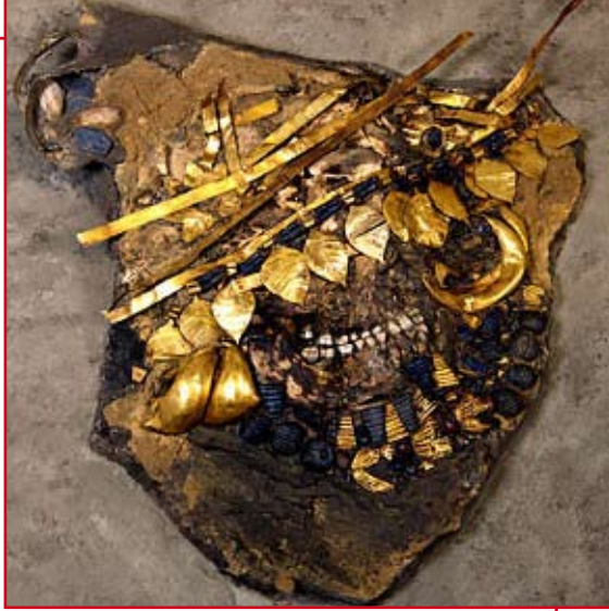
جمجمة امرأة مغطاة بالحلي عثر عليها في أحد مدافن أور.

إن اكتشاف حوالي 2000 مدفن قد برهن على ممارسة التضحية بالبشر على نطاق واسع في القدم. فعند موت الملك أو الملكة. وربما قبل ذلك، يتم قتل من يعمل في البلاط (الخادمت، المحاربتن...)، ثم ترتب أجسادهم على نسق محدد. فمثلاً: تكون الخادمت مرتديات قبعاتهن المزخرفة، وتوضع أسلحة المحاربتن إلى جانبهم.